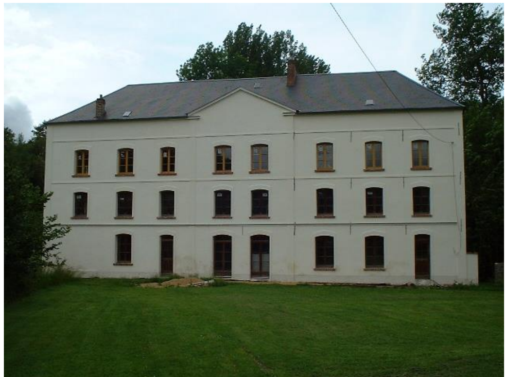
Le moulin en 2003